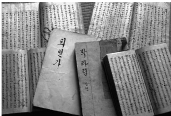
Manuskripte der Pansoris Sugung-ga und Heungbo-ga von SIN Jae-hyo, 2. Hälfte 19. Jahrhundert

Nun zu den Kernhandlungen der drei Pansori -Repertoirestücke, die im vorliegenden Buch vorgestellt werden.